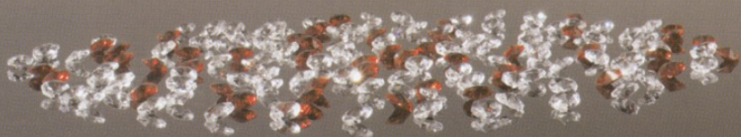
REFLEX 45 Alessandro Lenarda design