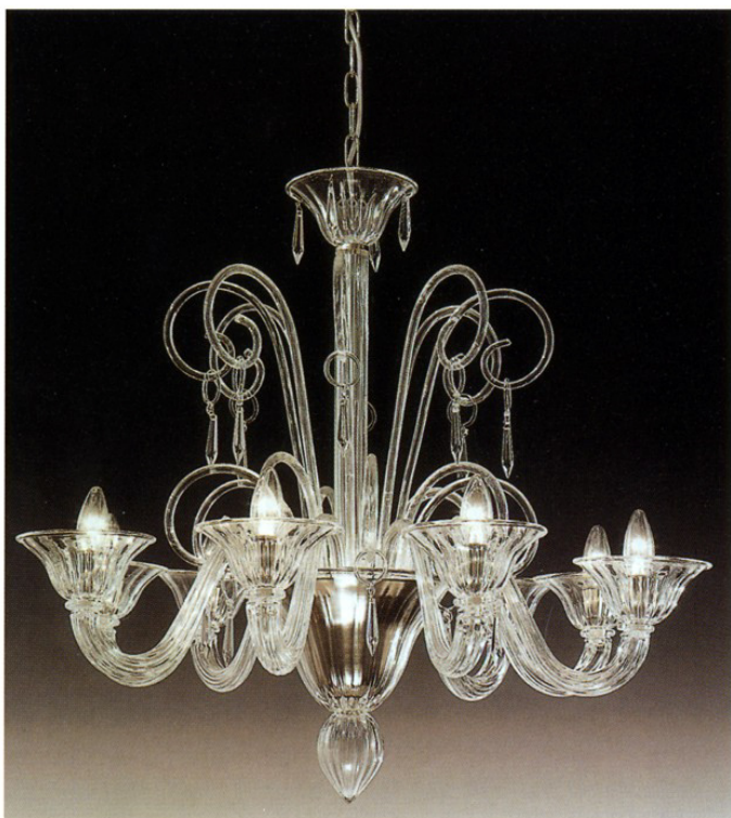
VOLTOLINA COLLEZIONE BACH