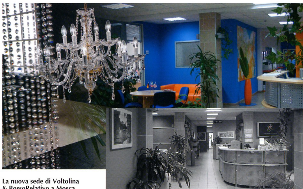
La nuova sede di Voltolina & RossoRelativo a Mosca

RossoRelativo è il brand che identifica la Società che si occupa di inserire e promuovere, in Russia, marchi italiani nel mercato dell'arredamento e dei complementi d'arredo. Un portafoglio prestigioso, che raccoglie i più importanti distributori