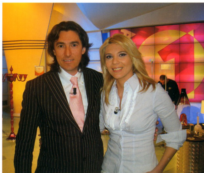
Andrea Voltolina con Eleonora Daniele conduttrice di UNOMATTINA su RAIUNO e, nello sfondo, una collezione di lampade dell'azienda veneziana Voltolina

impatto visivo, caratterizzati da un mood contemporaneo che sperimenta nuove forme. Illuminazioni capaci di arredare, creando atmosfere di stile. Design e tecnologia per il fiore all'occhiello del know-how di Voltolina . È il Sistema Leonardo che verrà presto presentato al mercato russo. Un rivoluzionario sistema di assemblaggio creato in esclusiva per i lampadari Voltolina .