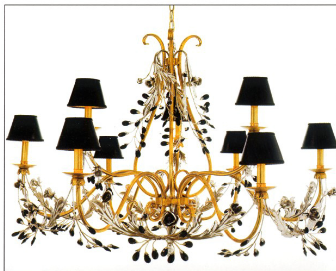
EURO LAMP ART